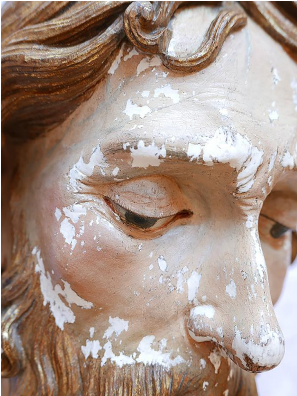
Doplnenie povrchu polychrómie kriedovým tmelom