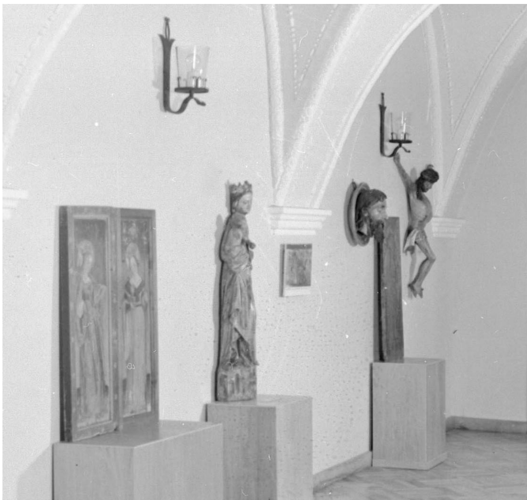
Predmet v expozícii Thurzov dom v roku 1958