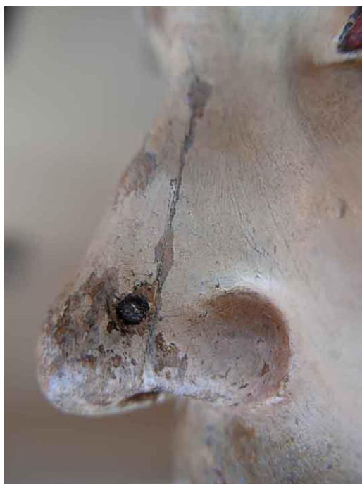
Detail nosa po odstránení retuší - rozsah úbytkov pôvodnej polychromie, zvyšky ružového sekundárneho podkladu a sekundárny kovový prvok, ktorý spevňuje materiál v mieste praskliny