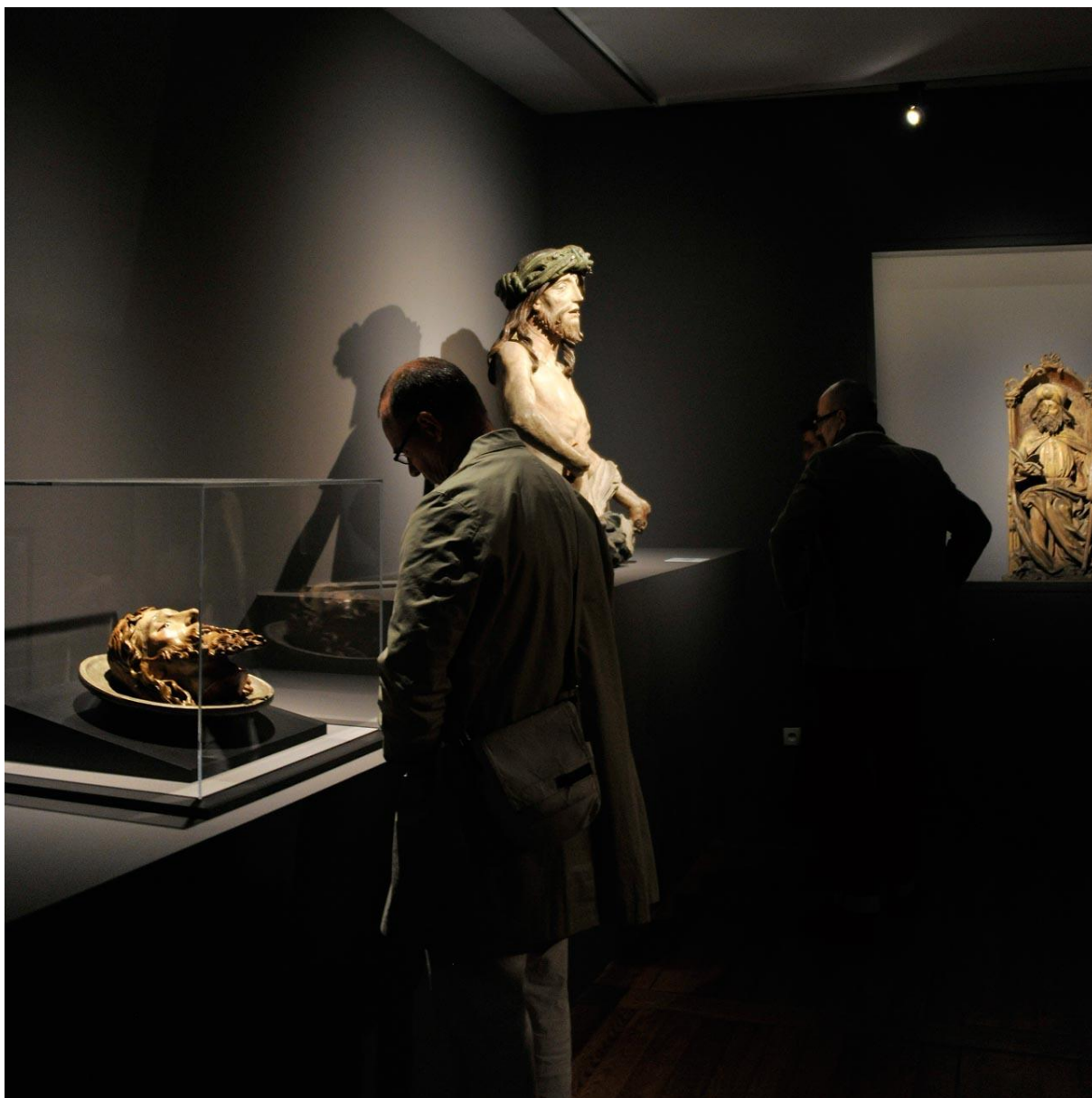
Predmet na výstave Nicolas Gerhaert de Leyde v Štrasburgu v roku 2012