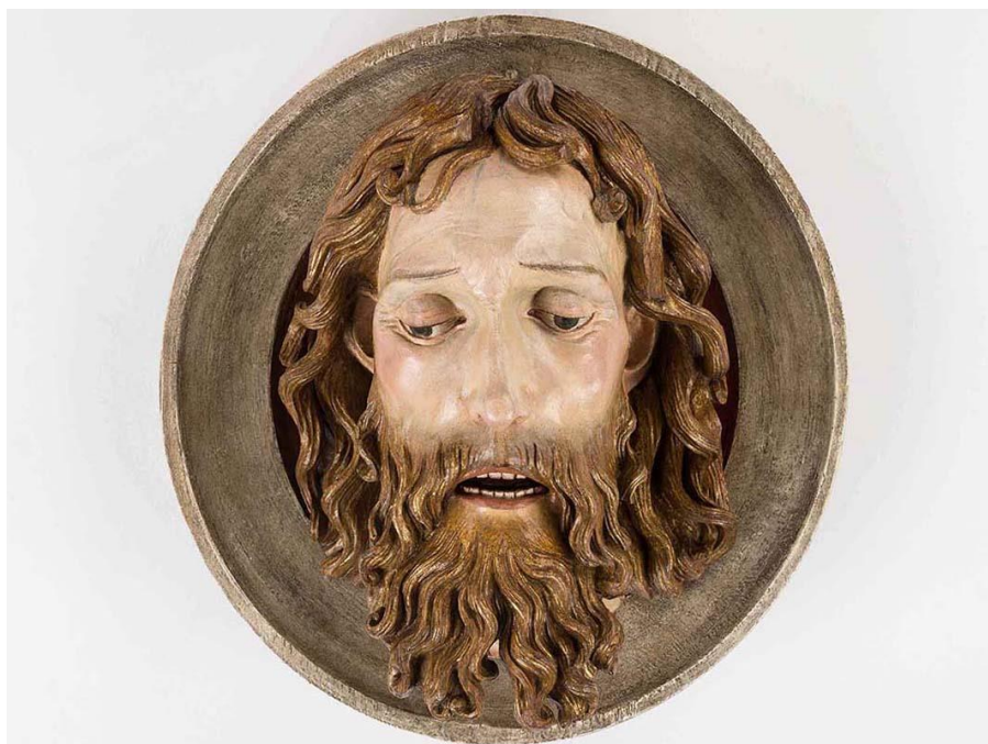
Stav po reštaurovaní a spojení obidvoch částí